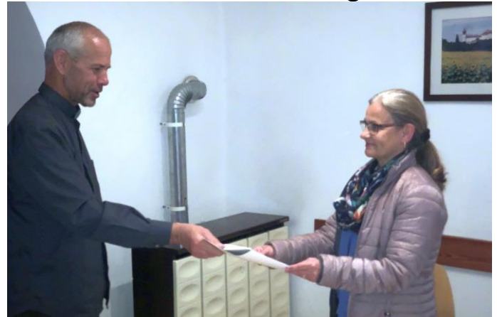
Pfarrkirchenrat Dekretübergabe - Mai