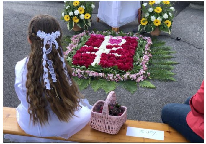
Fronleichnam - Juni