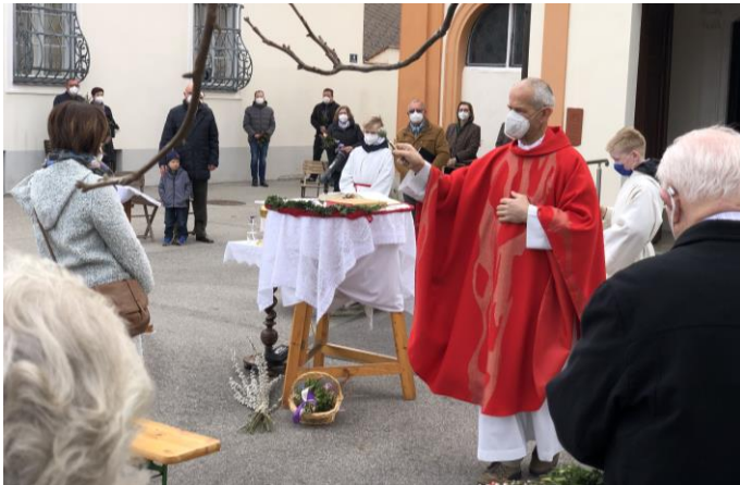
Palmweihe - März